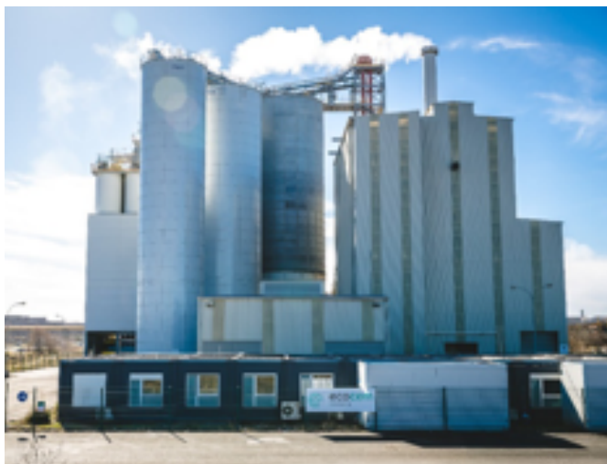
Usine de Fos-sur-Mer aux nouvelles couleurs du Groupe